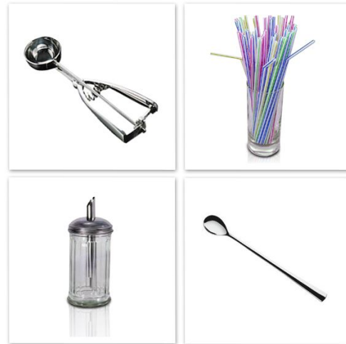
Foto: Lusini.de. Abdruck bei Quellenangabe und Belegexemplar honorarfrei

Zubehör und Accessoires für die Sommersaison in allen Preisklassen bei Lusini.de .